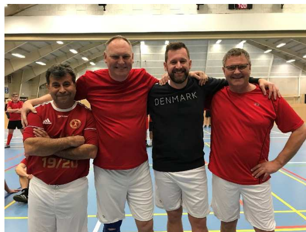
Byrødderne var med for første gang, og vandt Fighter pokalen.

Solstrålen og Frivilligcenter Fredericia afholdt torsdag den 11. april Fodbold på Tværs i Fredericia Idrætscenter. 12 hold deltog, og mere end 100 mennesker var til stede og var med til at skabe den gode stemning.