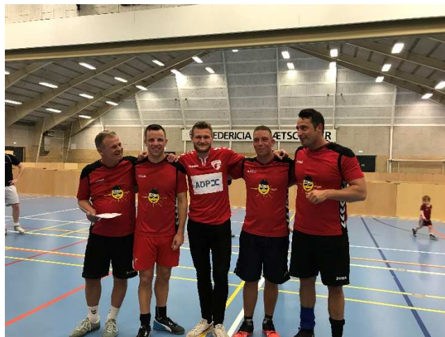
Solstrålens Veteraner blev nr. 2