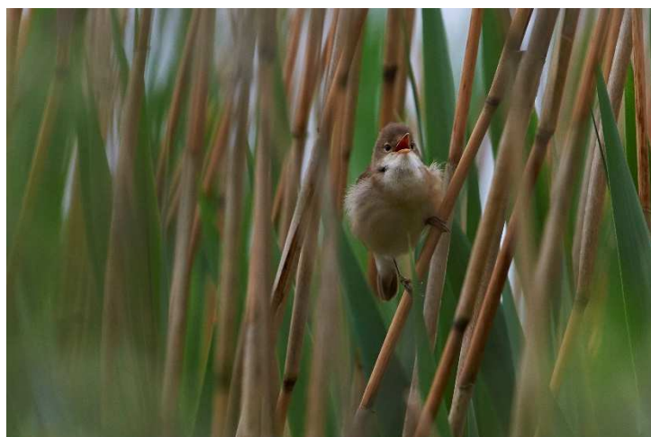
Rørsanger ved Rands Fjord