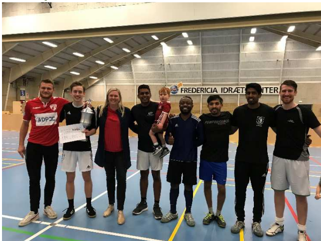
Apostolsk Kirke blev vindere af Fodbold på Tværs 2019