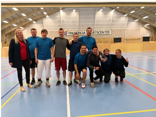
Debutanterne fra Kompetencecenter for Døve vandt pokalen for Bedste Kammeratskab.